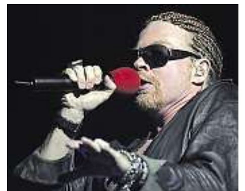
Axl Rose, chanteur de Guns'N Roses.

— Philippe Renaud, collaboration spéciale