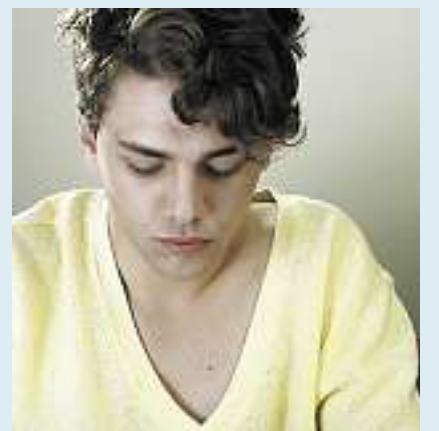
Xavier Dolan