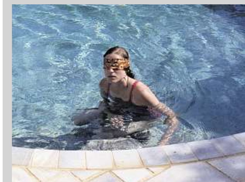
Canine de Yorgos Lanthimos.