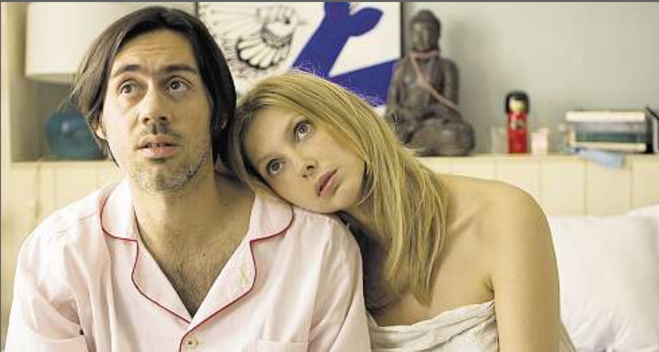
Fais-moi plaisir, un film d'Emmanuel Mouret avec Emmanuel Mouret et Judith Godrèche.