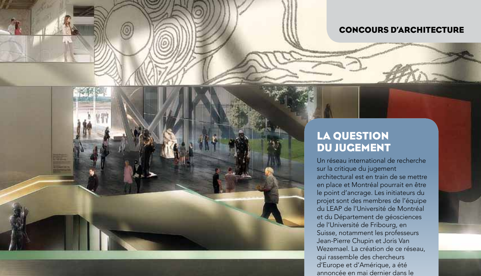
Esquisse du projet gagnant, Musée national des beaux-arts du Québec, Office for Metropolitan Architecture, Provencher Roy et associés Illustration : Luxigon