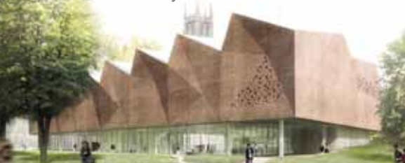
Esquisse du projet finaliste de Barkow Leibinger Architekten et Imrey Culbert