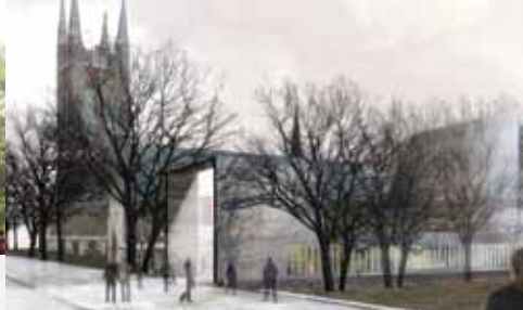
Esquisse du projet finaliste de Nieto Sobejano et Brière Gilbert et associés