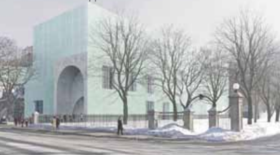
Esquisse du projet finaliste du Groupe Arcop et David Chipperfield